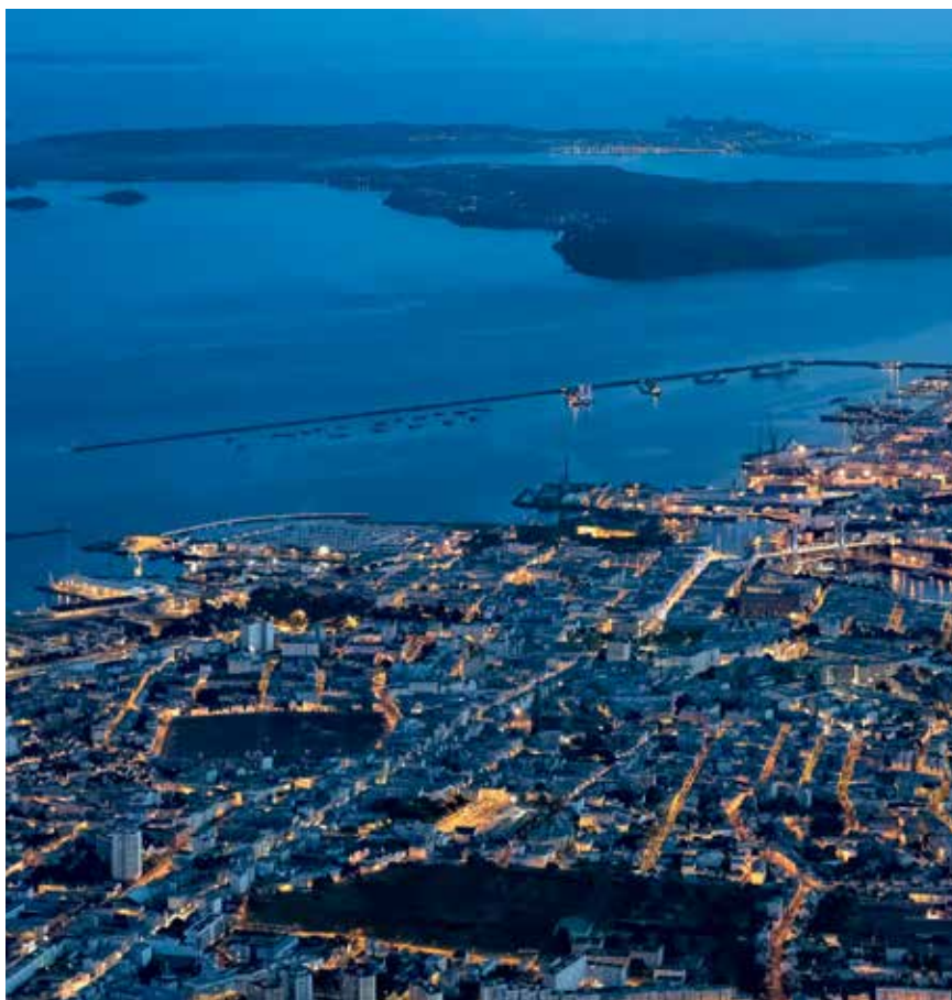
Vue aérienne

Grand-Ouest, Île de France, Marseille, Lyon : les bassins les mieux connectés.